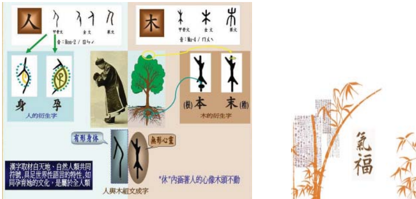
Рис. 4. Природні форми ієрогліфів

не могли так легко вводити в оману людей, тому вони плакали» [4]. Якщо уважніше розглянути хитросплетіння гілочок бамбука, то, як і Цан Цзе, можна побачити в них ієрогліфи.