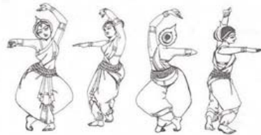
Рис. 1. Деванагарі — знаки і танець-комунікація

Нині санскрит — це не «мертва» мова, його справедливо вважають мовою освіченого населення й використовують для релігійних