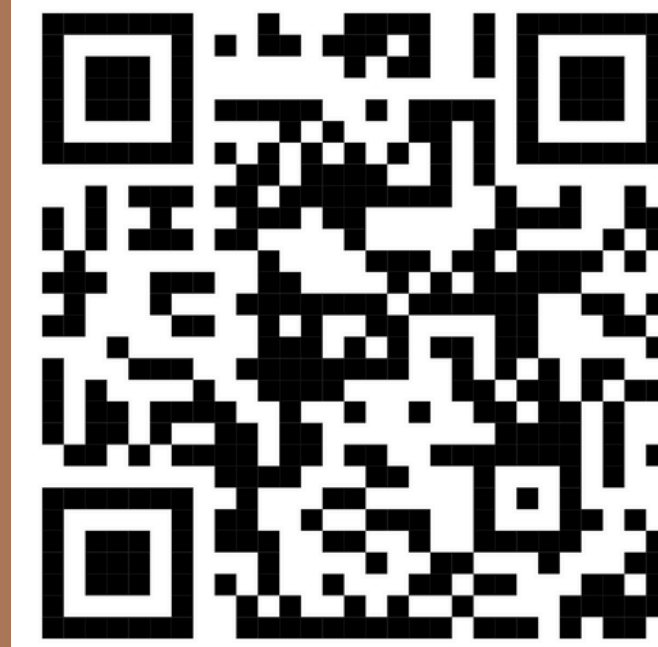
Перелік пунктів тестування за кордоном